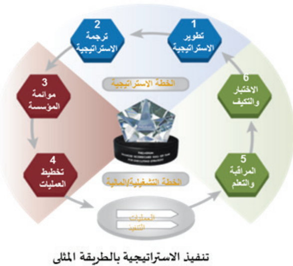
تنفيذ الاستراتيجية بالطريقة المثلى

بناء على منهجة كابلان و نورتون لإدارة الاستراتيجيات